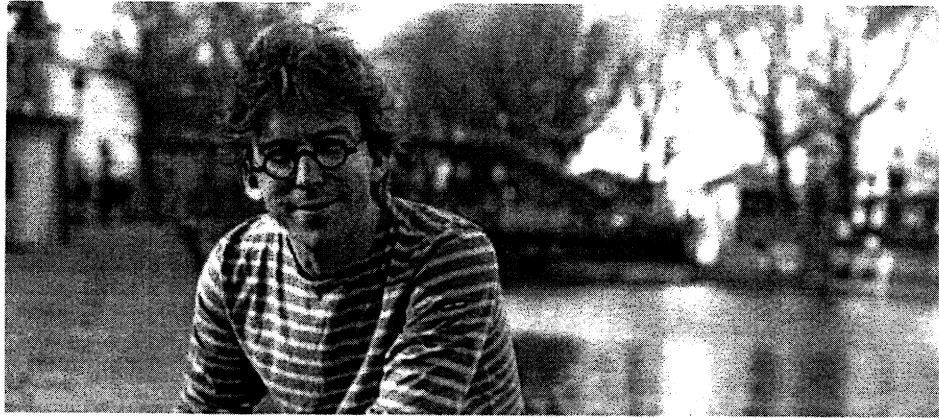
Fred Pellerin.

Dans "De peigne et de misère", le conteur québécois Fred Pellerin fait éclater les limites du genre.