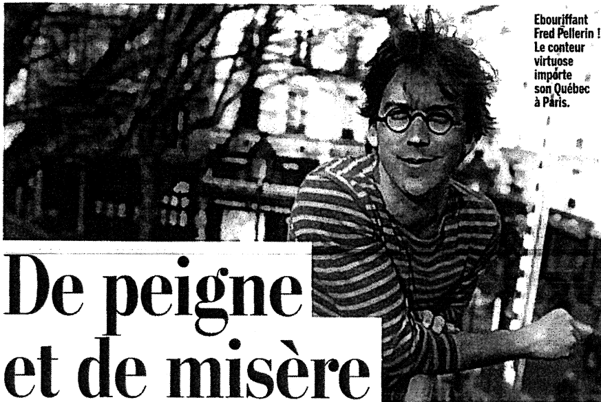
Ebouriffant Fred Pellerin ! Le conteur virtuose impérte son Québec à Paris.