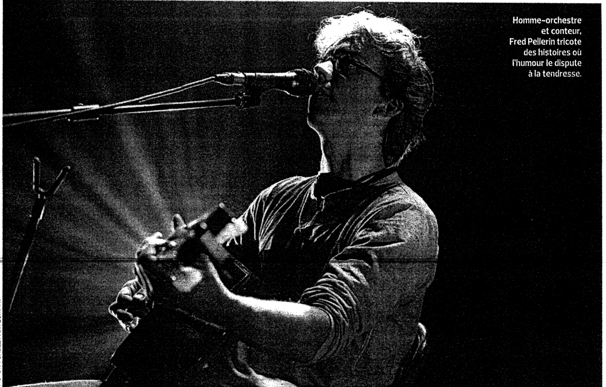
Homme-orchestre et conteur, Fred Pellerin tricote des histoires où l'humour le dispute à la tendresse.

Le « raconteur » québécois s'installe à Paris avec son étonnant spectacle, « De peigne et de misère » : des histoires extraordinaires et désopilantes.